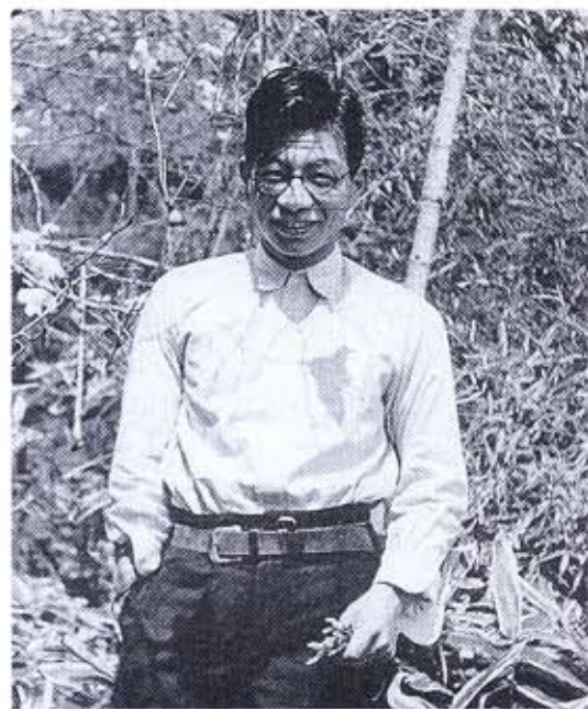
東京大学薬学科2年生 (昭和14年)