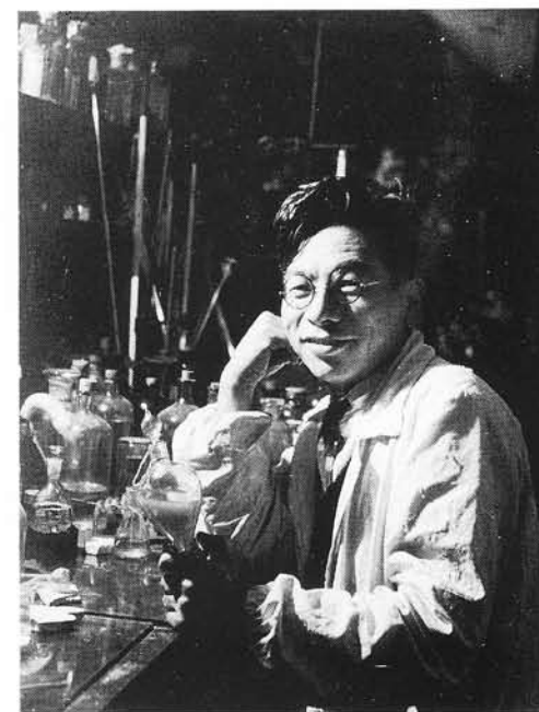
三共高峰研究所にて (昭和33年)