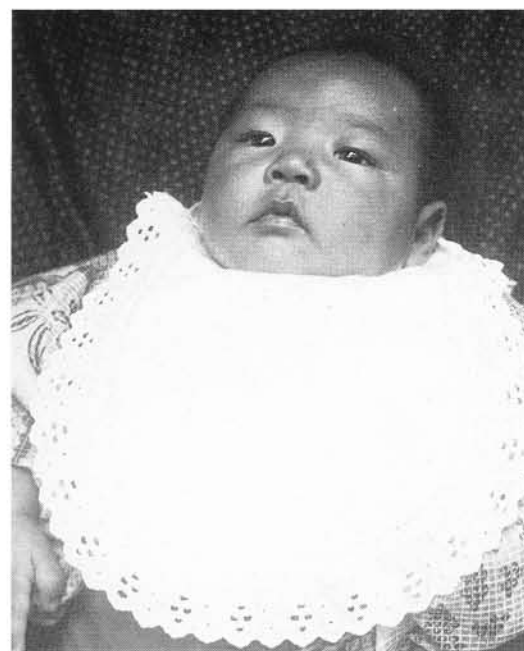
生後100日のお祝い(大正5年8月)