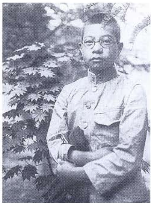
京城中学3年生 (昭和7年)