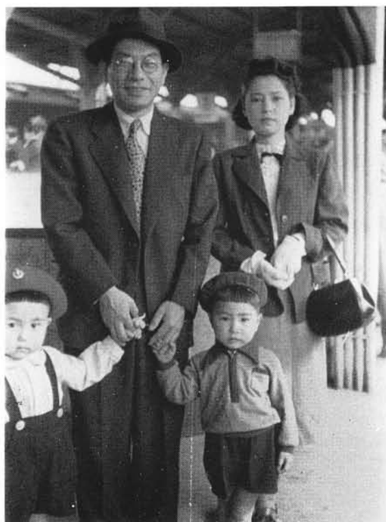
九州へ(東京駅にて) (昭和26年7月)