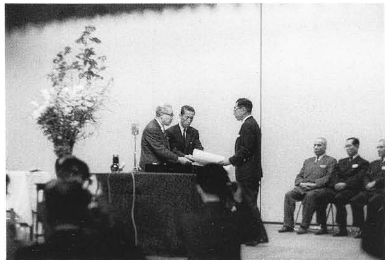
日本薬学会学術賞受賞 (昭和39年4月)