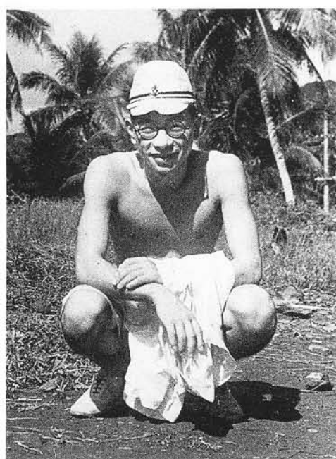
トラック島にて (海軍大尉, 昭和19年)